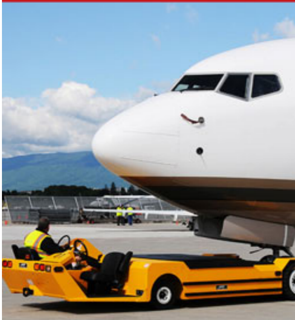
LEKTRO AP8950SD / Boeing 737